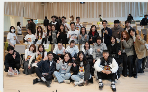
唐式基金會 x 商進